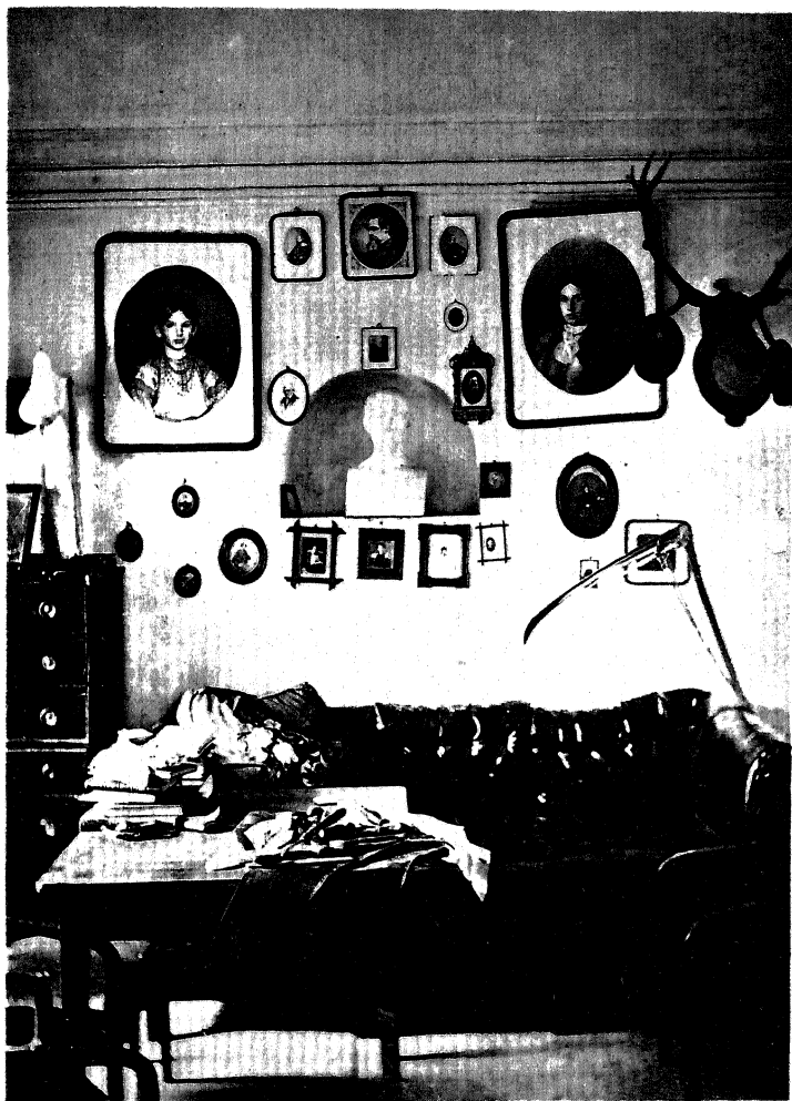
КАБИНЕТ ТОЛСТОГО В ЯСНОЙ ПОЛЯНЕ В 1871—1889 гг.