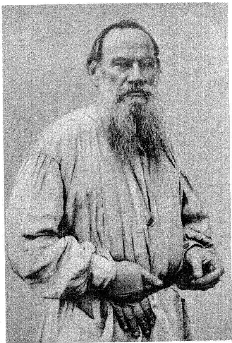
Л. Н. ТОЛСТОЙ в 1891 г.