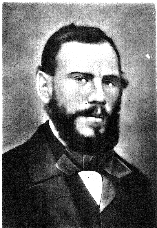
Л. Н. ТОЛСТОЙ 1862 г.